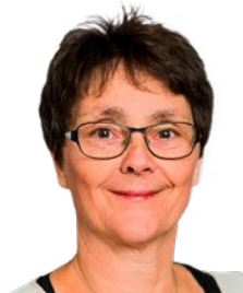
Monika Heinold, Finanzministerin des Landes Schleswig-Holstein

Falls es von Ihrer Seite Fragen gibt, die in dieser Broschüre nicht beantwortet werden, dann wenden Sie sich vertrauensvoll an die Mitarbeiterinnen und Mitarbeiter der Finanzämter. Dort wird Ihnen gerne weiter geholfen.