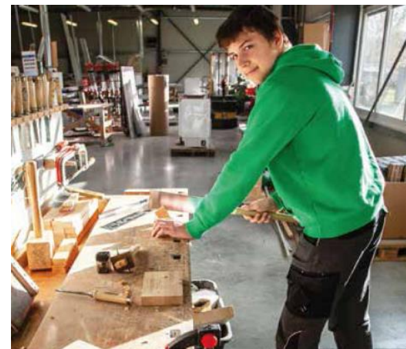
Беньямін під час практичного навчання в меблевій майстерні

Адреси для контактів за лінком: www.iple.de