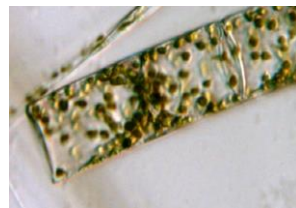
Guinard-Kieselalge ( Guinardia flaccida ) L = 0,05 mm