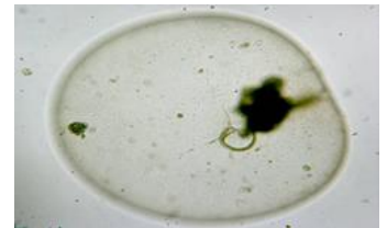
Meeres-Leuchttierchen ( Noctiluca scintillans ) Ø = 0,7 mm