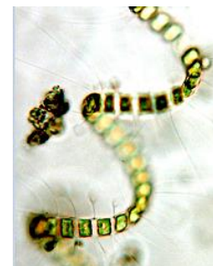
Borsten-Kieselalge ( Chaetoceros debilis ) Ø = 0,04 mm

Auf die Badewasserqualität haben die beobachteten Mikroalgenarten bzw. ihre Konzentrationen keinen negativen Einfluss.