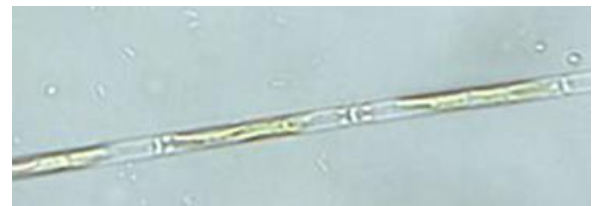
Kleine Walzen-Kieselalge ( Leptocylindrus minimus ) Ø = 0,005 mm