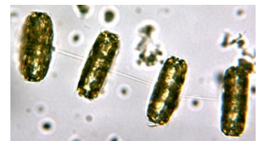
Scheiben-Kieselalge ( Thalassiosira rotula ) Ø = 0,008 mm