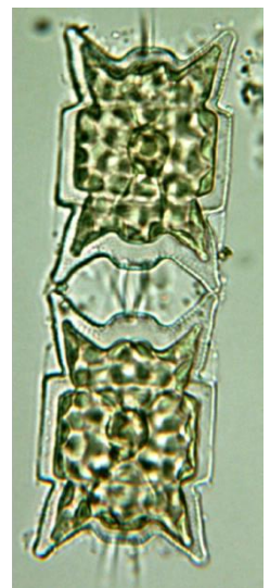
Odontella-Kieselalge ( Odontella aurita ) L = 0,1 mm