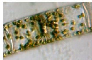
Guinard-Kieselalge ( Guinardia flaccida ) Ø = 0,08 mm