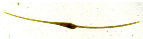
Hörner-Zweigeißelalge ( Ceratium fusus ) L = 0,4 mm