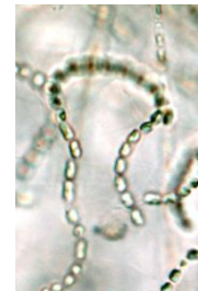
Borsten-Kieselalge ( Chaetoceros socialis ) L = 0,01 mm

Auf die Badewasserqualität haben die beobachteten Mikroalgenarten bzw. ihre Konzentrationen keinen negativen Einfluss.