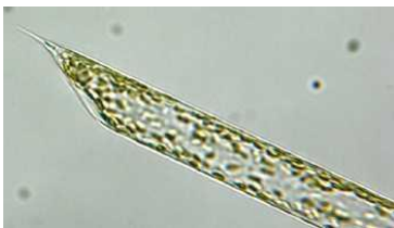
Röhren-Kieselalge ( Rhizosolenia imbricata ) L = 0,2 mm