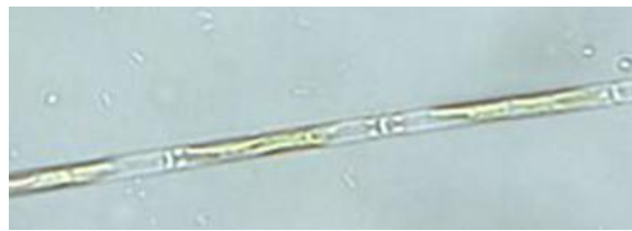
Kleine Walzen-Kieselalge ( Leptocylindrus minimus ) Ø = 0,005 mm