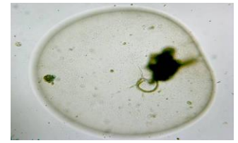
Meeres-Leuchttierchen ( Noctiluca scintillans ) Ø = 0,7 mm