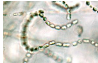
Borsten-Kieselalge ( Chaetoceros socialis ) L = 0,01 mm