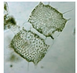
Odontella-Kieselalge ( Odontella regia ) L = 0,3 mm

Im gesamten Bereich sind kleine Flagellaten vertreten, am häufigsten östlich von Sylt . Ebenso sind im gesamten Bereich geringe Anzahlen des Meeres-Leuchttierchens (Noctiluca) und der Borsten-Kieselalge zu beobachten.