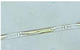
Kleine Walzen-Kieselalge ( Leptocylindrus minimus ) Ø = 0,005 mm

Auf die Badewasserqualität haben die beobachteten Mikroalgenarten bzw. ihre Konzentrationen keinen negativen Einfluss.