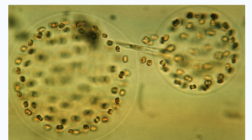
Schaumalge ( Phaeocystis globosa ) Ø = 50 µm

Am 6.9.2011 wurden an 16 Stellen der Nordsee Wasserproben genommen (siehe Karte). Regnerisches und windiges Wetter hatten in den vorangegangenen Tagen die Küstengewässer durchmischt und dadurch den Anteil aufgewirbelten Sedimentes im Wasser deutlich erhöht. Mikroalgen haben der Jahreszeit entsprechend deutlich abgenommen. Neben Kieselalgen sind nur vereinzelt andere Mikroalgen vertreten.