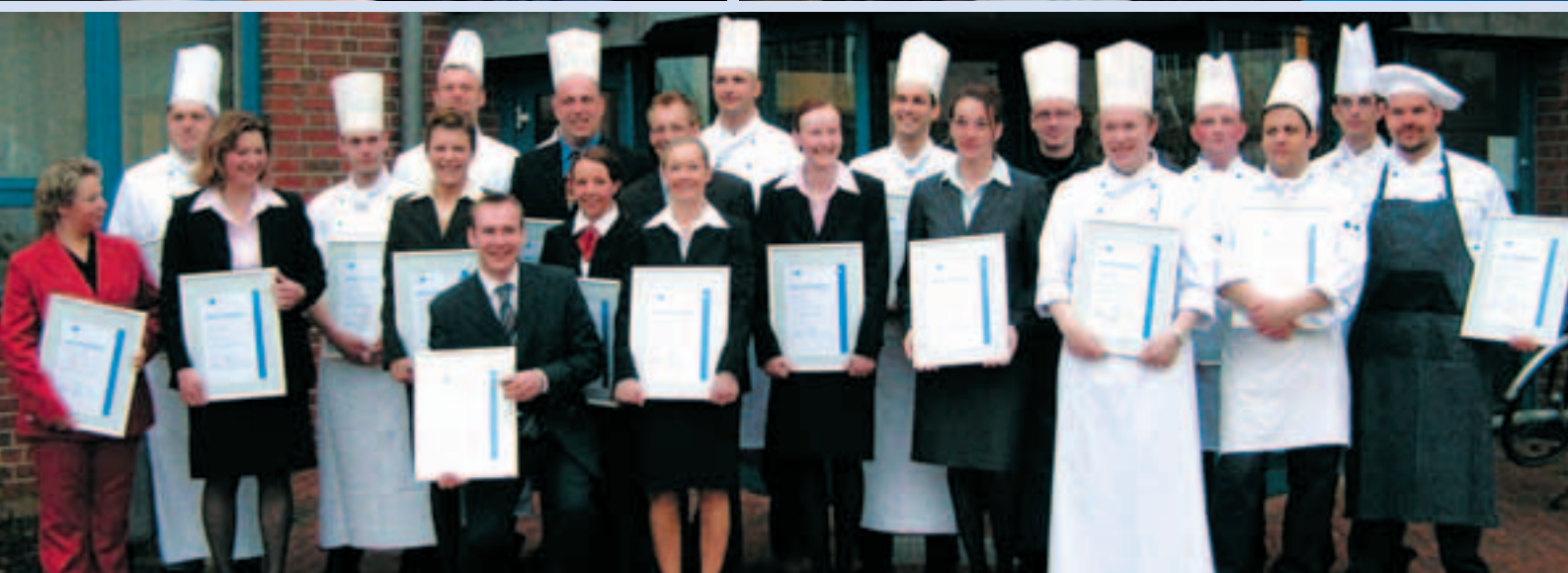
Eine gute Qualifikation ist nach wie vor der beste Weg, die eigenen Chancen am Arbeitsmarkt zu verbessern. Dazu gehören eine gute Ausbildung, aber ebenso die Bereitschaft, sich lebenslang weiterzubilden. Bildung ist der Schlüssel zu Integration und sozialer Teilhabe. Auch im Betrieb gilt es, vorausschauend zu handeln und sich für die Fort- und Weiterbildung zu engagieren.