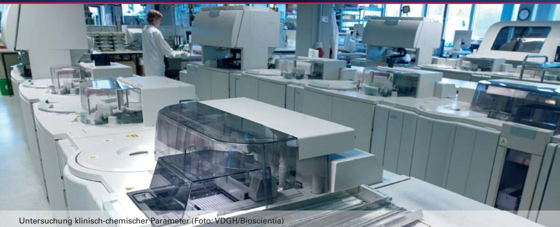
Untersuchung klinisch-chemischer Parameter