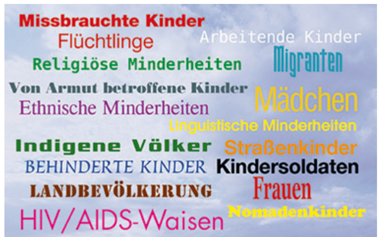
Beispiele für Kinder, die vom Bildungswesen ausgeschlossen und/oder marginalisiert sind (UNESCO 2010, S. 9)

Ein umfassendes Verständnis von Inklusion versucht dagegen, diese einseitige Sichtweise zu vermeiden: Jedes Kind zählt, kein Kind wird zurückgelassen. Der pädagogische Fokus richtet sich entsprechend nicht nur auf Kinder mit Behinderungen, sondern nimmt alle Formen der menschlichen Vielfalt in den Blick. Geschlecht, soziale Herkunft, Alter oder kultureller Hintergrund werden ebenfalls mitbedacht, „[...] sodass sie [die Inklusion, M.S.] mit anderen Ansätzen wie der interkulturellen und der gender-