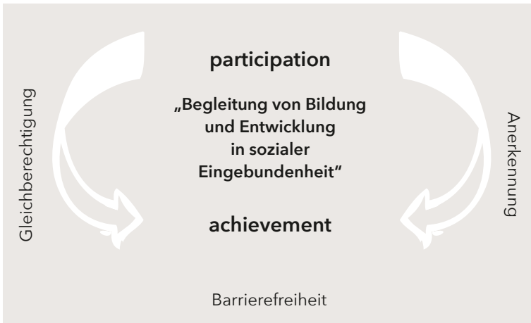
(Abb.: Seitz 2012)