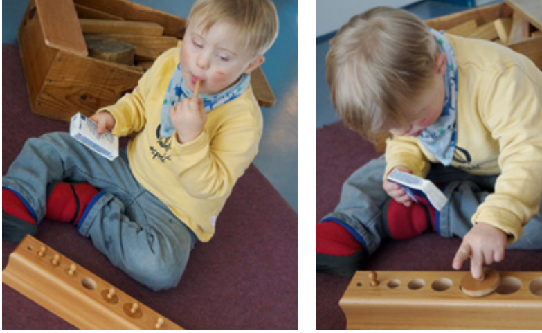
Spiel mit Montessori-Material