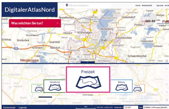
Abbildung 1: Hauptportal DANord

Zugriff: http://portal.digitaleratlasnord.de