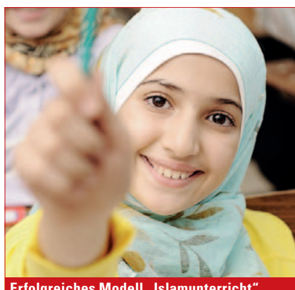
Erfolgreiches Modell „Islamunterricht“