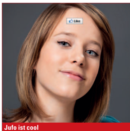
Jufo ist cool