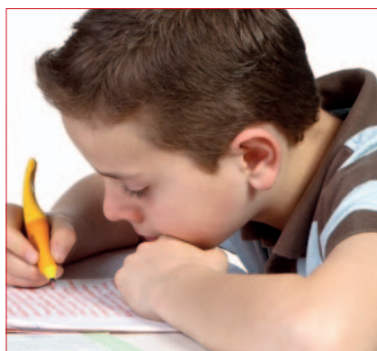
Sprachbildung verbessert Bildungschancen